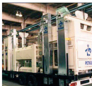
BE 100 mobil és stabil üzemű gépek kiszolgálásához