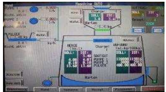
Automata üzemmód kijelzője

Szabadon programozható vezérléssel a különböző szakaszok ideje beállítható. Programok segítségével gyorsan és pontosan megismételhetők a receptek.